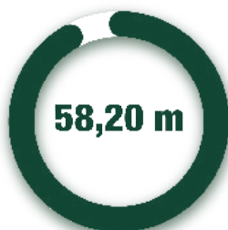
HORIZONTAL / HORIZONTAL