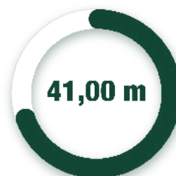
PROFUNDIDAD / PROFUNDIDADE