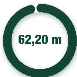
VERTICAL / VERTICAL